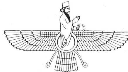
De engelbewaarder Dit is een voorstelling van een ffravashi of engelbewaarder. Het stelt zowel de goddelijke kern in mensen als 'het spirituele zelf' of Ahura Mazda voor.